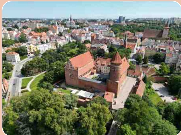
(Schloss Olsztyn: Foto von Monika Towianska)

Am Abend erwartet Sie im Hotel ein Folkloreabend mit masurischen Spezialitäten, Musik, Tanz und natürlich dem Nationalgetränk Wodka.