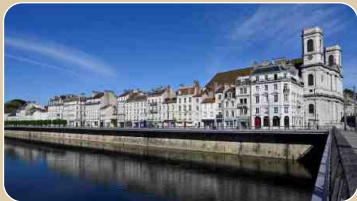
Blick über den Fluss Doubs auf das 'Battant'-Viertel.

1674 wurde die Stadt vom Sonnenkönig Ludwig XIV. erobert und Frankreich angegliedert. Aus dieser Zeit stammt auch die Zitadelle, die sich direkt über 11 Hektar erstreckt - angelegt von Festungsbaumeister Vauban.