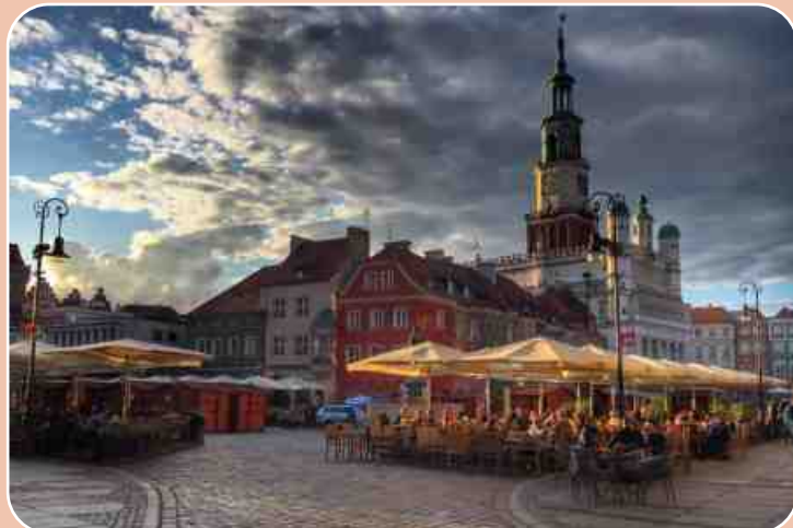
Der Alte Markt in Posen

Posen ist eine der ältesten Städte Polens und zugleich eine der lebendigsten. Die Metropole an der Warthe verbindet Jahrhunderte alte Geschichte mit pulsierendem Stadtleben. Wer Posen besucht, erlebt nicht nur prächtige Kirchen sondern auch eine rekonstruierte Altstadt, Festivals und moderne Galerien, die in ganz Polen bekannt ist.